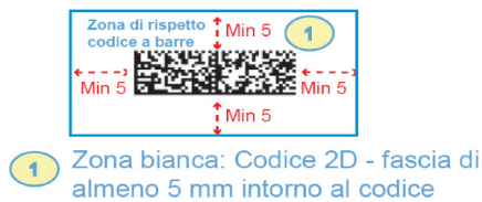
Figura 1 Codice Datamatrix

Al fine di garantire l'individuazione del codice 2D da parte dei sistemi di lettura automatica, è necessario riportare il codice al di sopra del blocco indirizzo (vedere layout di seguito riportati) e lasciare una zona di rispetto costituita da una fascia di colore bianco di almeno 5 mm di larghezza intorno al codice (vedi immagine di seguito riportata) attenendosi in ogni caso ai requisiti minimi riportati nell'apposita scheda tecnica sopra menzionata.